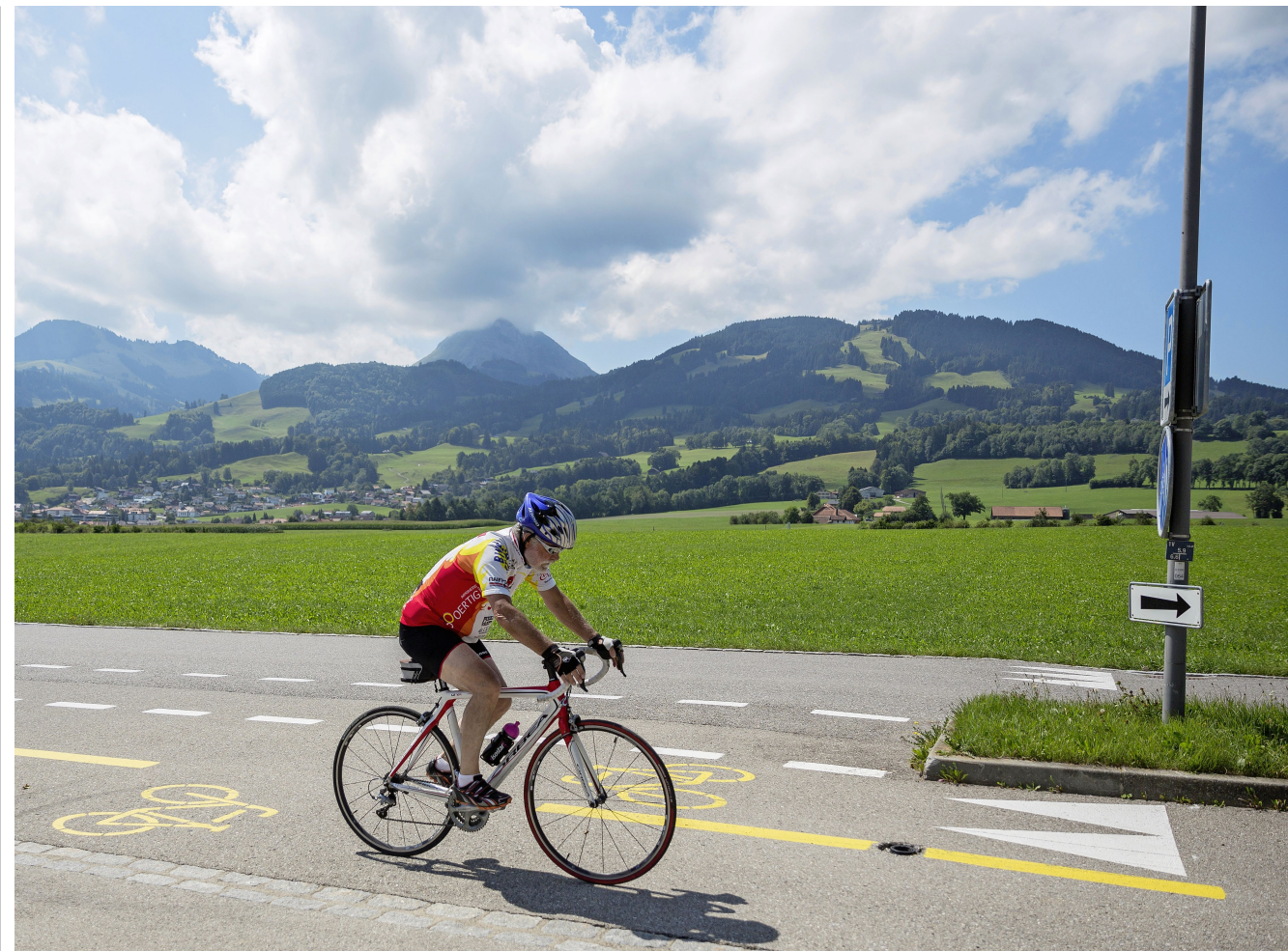
A Bulle, la petite reine n'est pas très populaire: la part des déplacements à vélo se monte à 2% seulement.

A la fin des années 1970, Bulle (FR) et La Tour-de-Trême (FR) comptaient à peine 10 000 âmes. Aujourd'hui, la population de ces deux communes, qui ont fusionné depuis, dépasse les 22 000 habitants. Avec l'arrivée de l'autoroute en 1981, la démographie du chef-lieu de la Gruyère a donc littéralement explosé. Et le trafic aussi, malgré l'ouverture fin 2009 de la route de contournement H189.