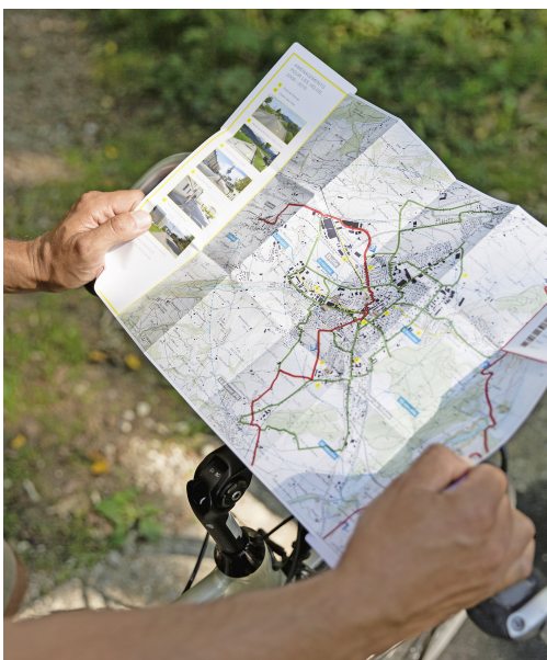
Les autorités tissent un réseau cyclable entre les communes de l'agglomération bulloise.

La capitale gruérienne semble donc être sur les bons rails, elle qui a reçu l'an passé un prix d'encouragement de Pro Velo Suisse pour son «engagement très focalisé, structuré et volontaire» en faveur des cyclistes. Le jury a relevé à cette occasion que «la voie choisie par Bulle était exemplaire, et à coup sûr encourageante pour d'autres communes de taille moyenne qui hésiteraient encore à se lancer, notamment en Suisse romande». Celles-ci se reconnaîtront. MM →