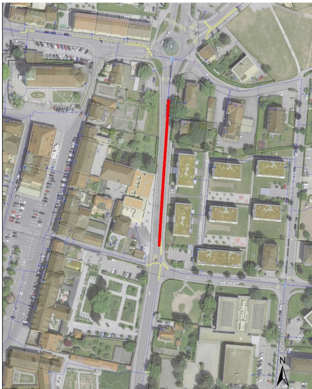
Rue de la Condémine

Pour le réseau d'eau, il s'agit de profiter de ces travaux afin de réhabiliter un tronçon de conduite qui a été mis hors service temporairement à la suite de ruptures de canalisation répétées. Le projet prévoit la pose d'environ 140m de tuyaux en fonte d'un diamètre nominal de 150mm et d'une nouvelle borne hydrante, ainsi que la reprise des branchements privés situés sur le domaine public.