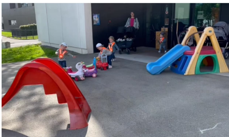
Photo de l'espace de jeu extérieur actuel

En l'absence de lieu dédié spécifiquement aux enfants en bas-âge, la direction de la crèche « Les Lutins » a régulièrement fait part au Conseil communal de son souhait de créer une véritable place de jeux extérieure. Aujourd'hui, la crèche doit composer avec la place bitumée située devant l'entrée de la crèche.